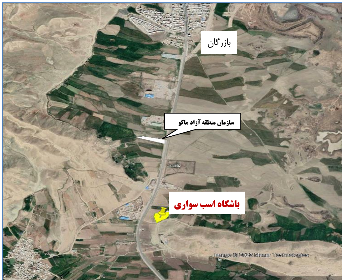
سایت پلن محل اجرای پروژه: